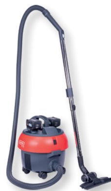
S10 Plus CAS