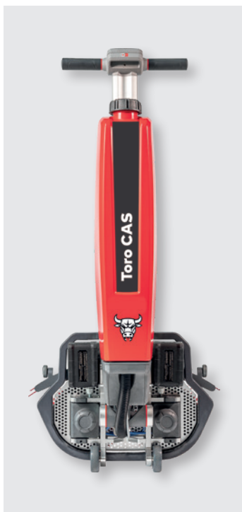
Cleanfix Toro CAS in Transportposition