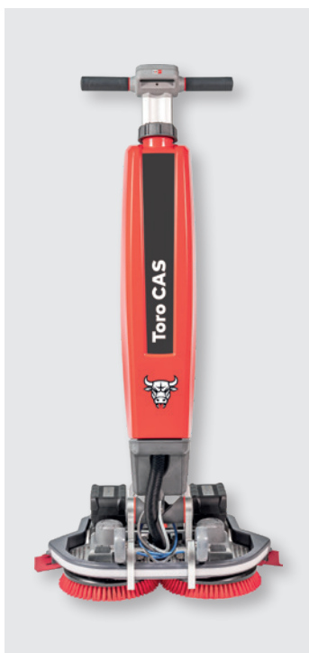
Cleanfix Toro CAS in Arbeitsposition